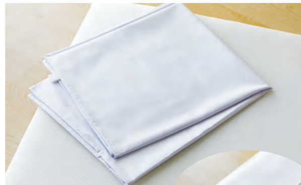
OR-S-J サイズ：長 1,270× 幅 760mm 重さ：202g

「保育園用マットレス」のための専用シート。サラサラとしたやさしい寝心地で快適です。 また、裏がポケット式構造になっているので脱着が簡単なおえ、シートがズレる心配もありません。