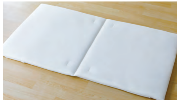
OB-731MJ サイズ：長 1,240× 幅 710× 厚 30mm 重さ：1.6kg

自然な寝姿を保持し、寝返りもうちやすい、ほどよい弾力をそなえたクッション素材「プレスエア」を採用しました。96%が空気層なので、ムレにくく通気性が抜群。耐久性にもすぐれています。汚れても手軽に洗えてすぐに乾く、保育園に最適なマットレスです。