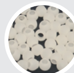
オレフィン系熱可塑性複合樹脂

※安全にご使用頂くためにご使用の際には必ず医師や看護師のほか理学療法士など専門員に指導を受ける事を推奨します。