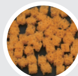
ポリウレタンフォーム